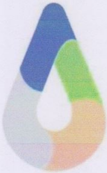
สัญลักษณ์รูปหยดน้ำ

อถล. เป็นการรวมกลุ่มของประชาชนในท้องถิ่นที่มีจิตอาสาในการช่วยเหลืองานขององค์กรปกครองส่วนท้องถิ่น เกี่ยวกับการจัดการสิ่งปฏิกูลและมูลฝอย การปกป้องและรักษาทรัพยากรธรรมชาติและสิ่งแวดล้อม